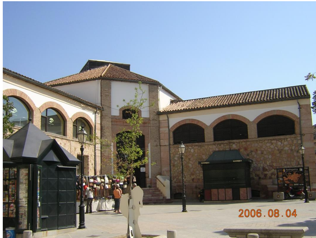
Vista desde la Plaza de San Francisco.