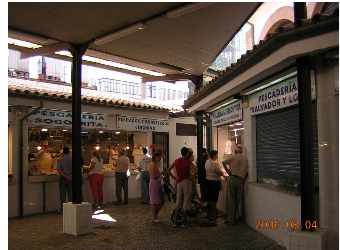
Área de pescaderías. Deficiente iluminación