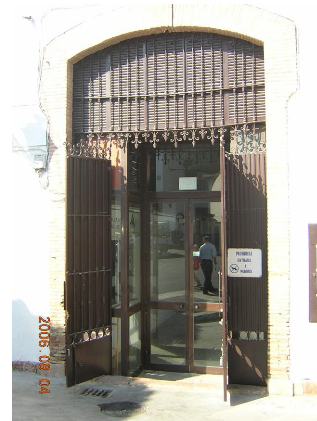
Necesidad de estudio de accesos al público