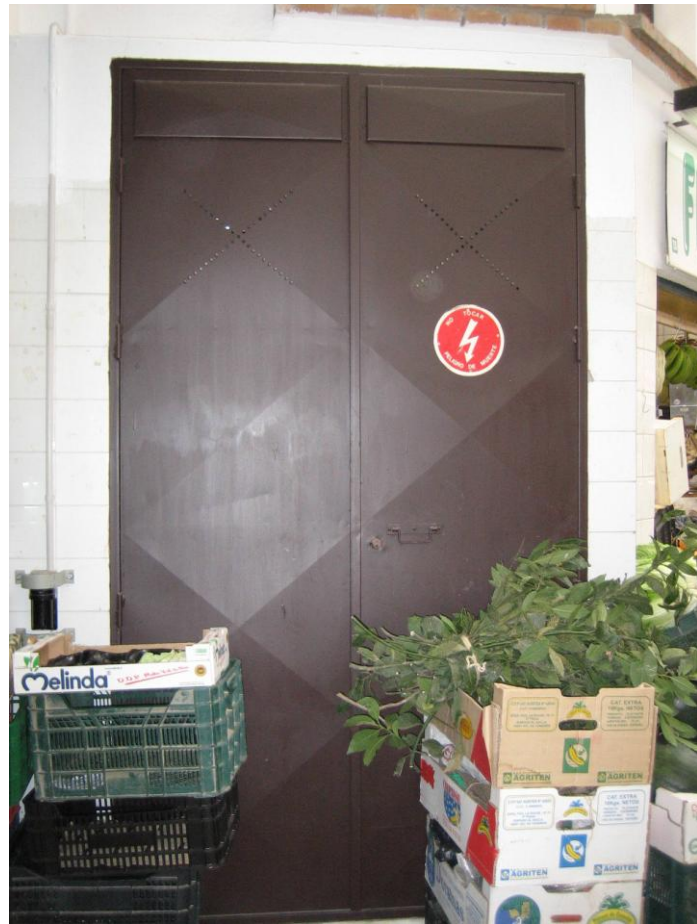
Acceso a cuarto técnicos invadidos