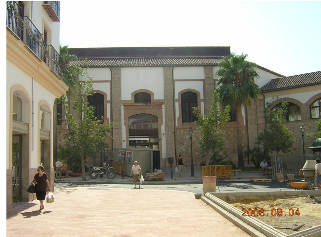
Nueva urbanización acceso Oeste.