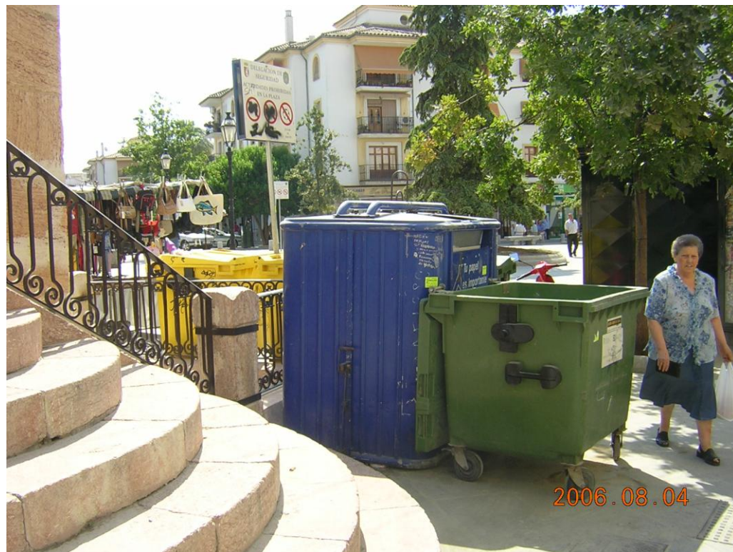
Aglomeración de contenedores de residuos.