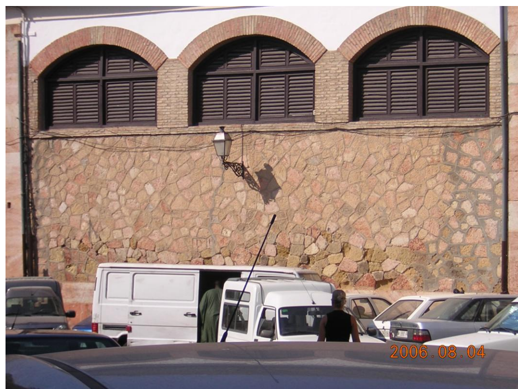
Efectos en la mampostería de las humedades subyacentes