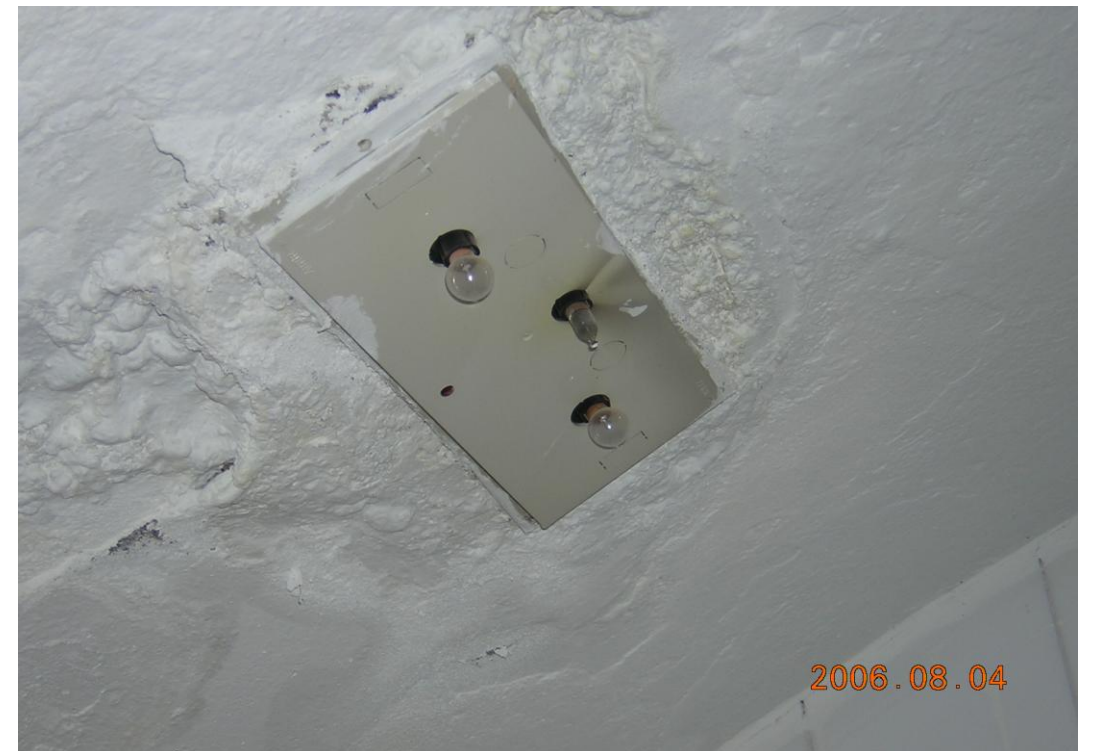
Luminaria de emergencia. Instalaciones deficientes