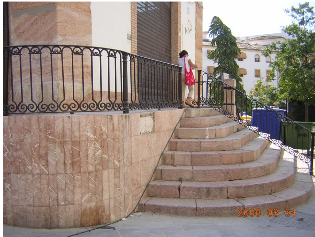
Acceso a local de restauración. Única puerta adaptada a minusválidos en esta zona.