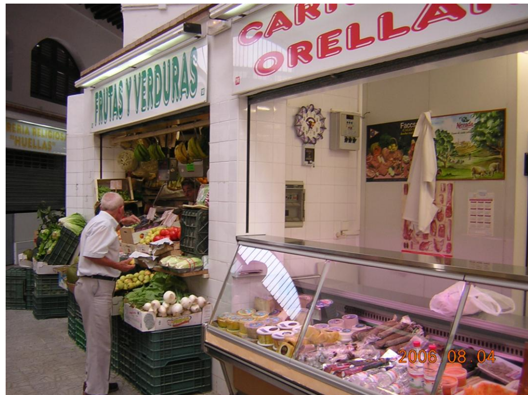
Invasiones frecuentes de pasillos de compradores.