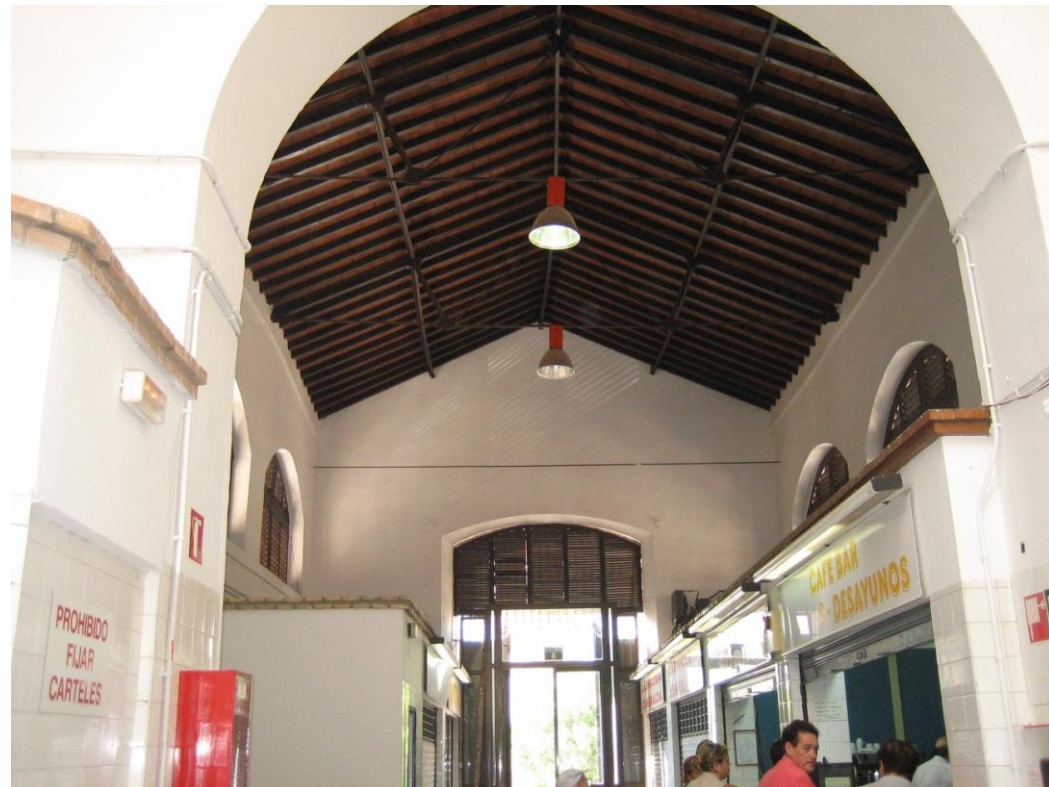
Vista de ala secundaria. Escasa iluminación.