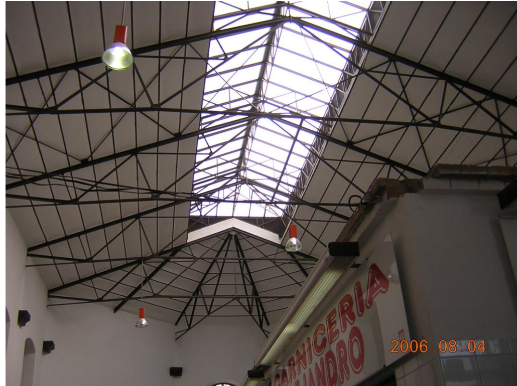
Vista general de la cubierta y lucernarios en buen estado