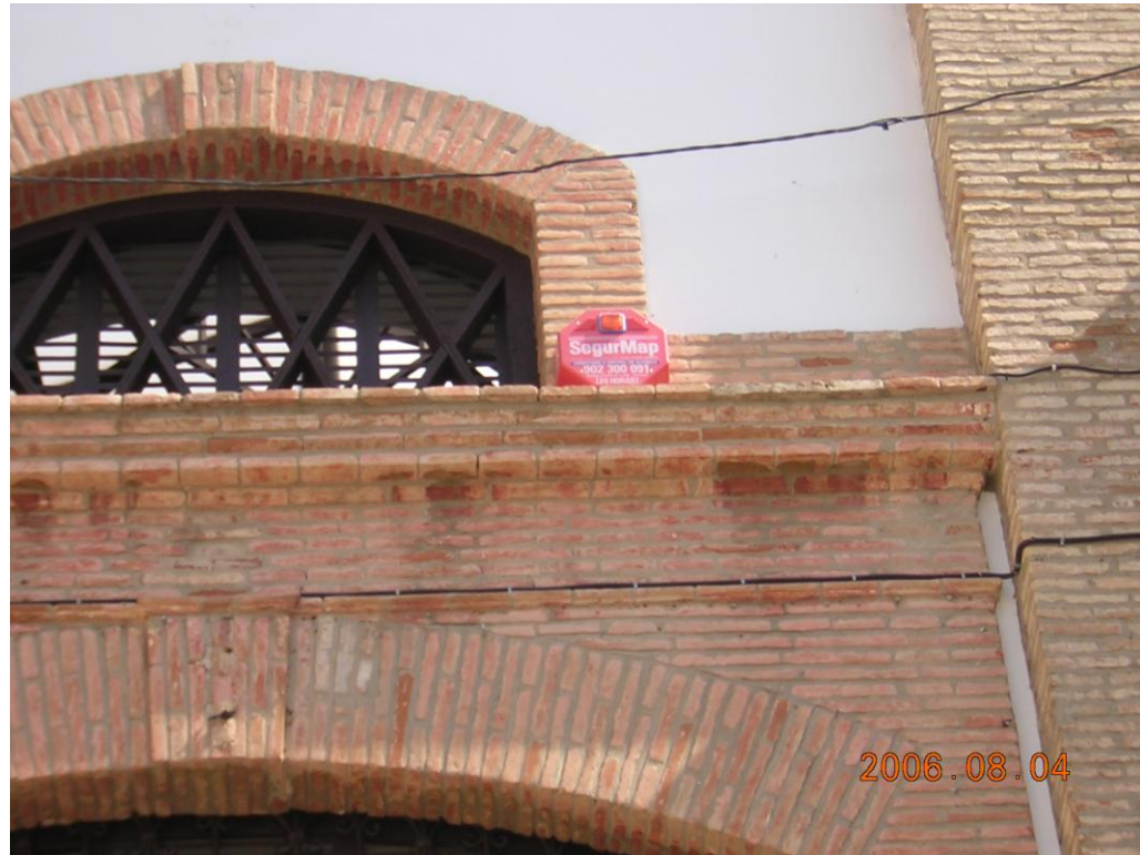
Instalación de seguridad. Abundante cableado en fachada.