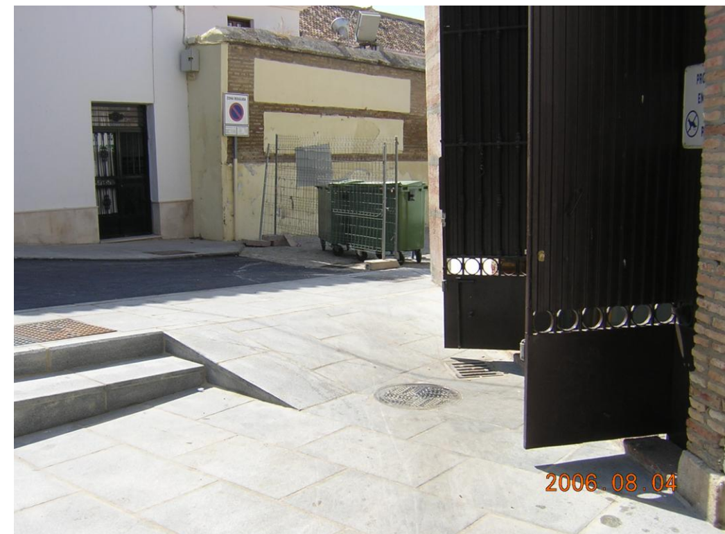
Absorción de desniveles para acceso al mercado desde puerta Norte