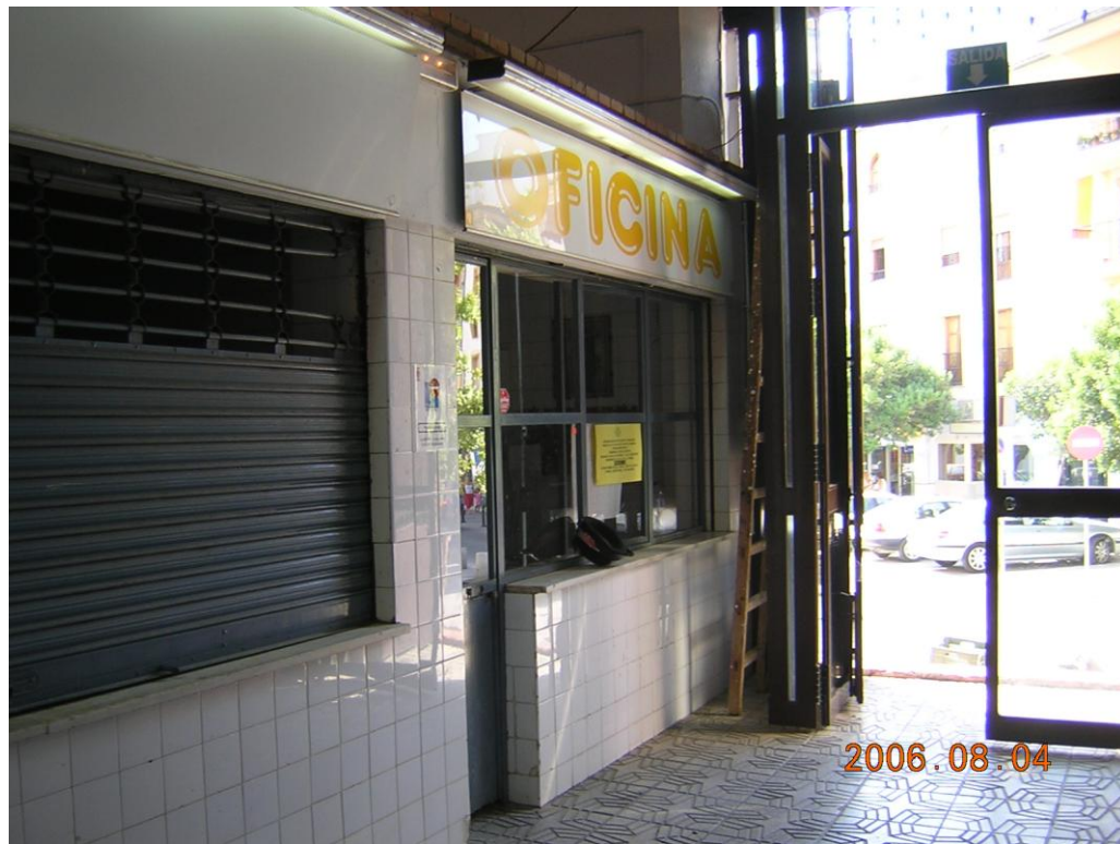
Oficina del Mercado ubicada en un puesto vacío