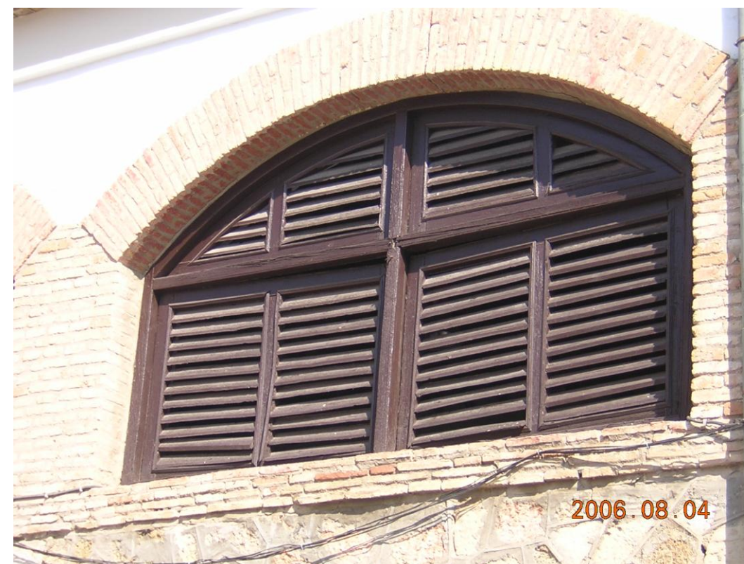
Carpinterías exteriores necesitadas de restauración