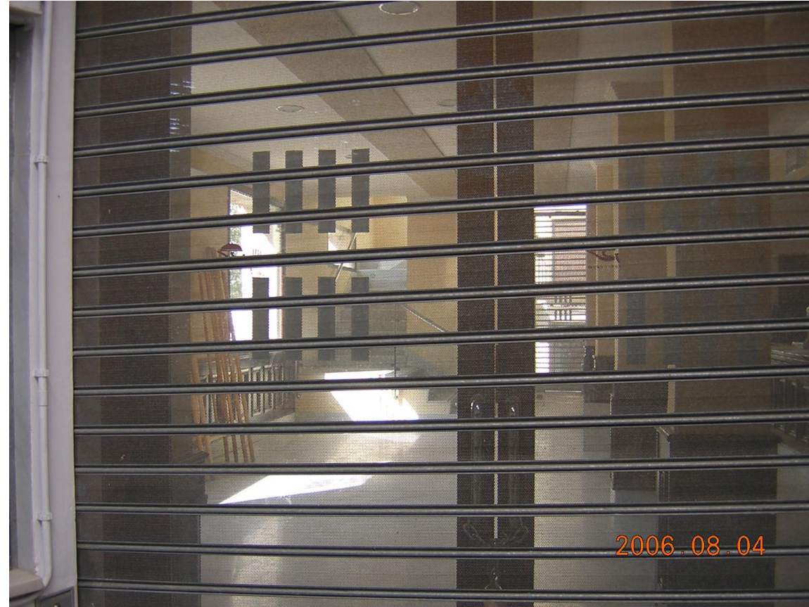
Establecimiento de restauración cerrado.