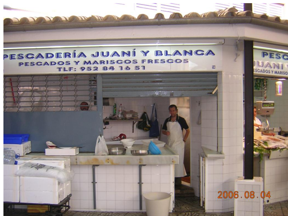
Mejorables condiciones de almacenaje y exposición