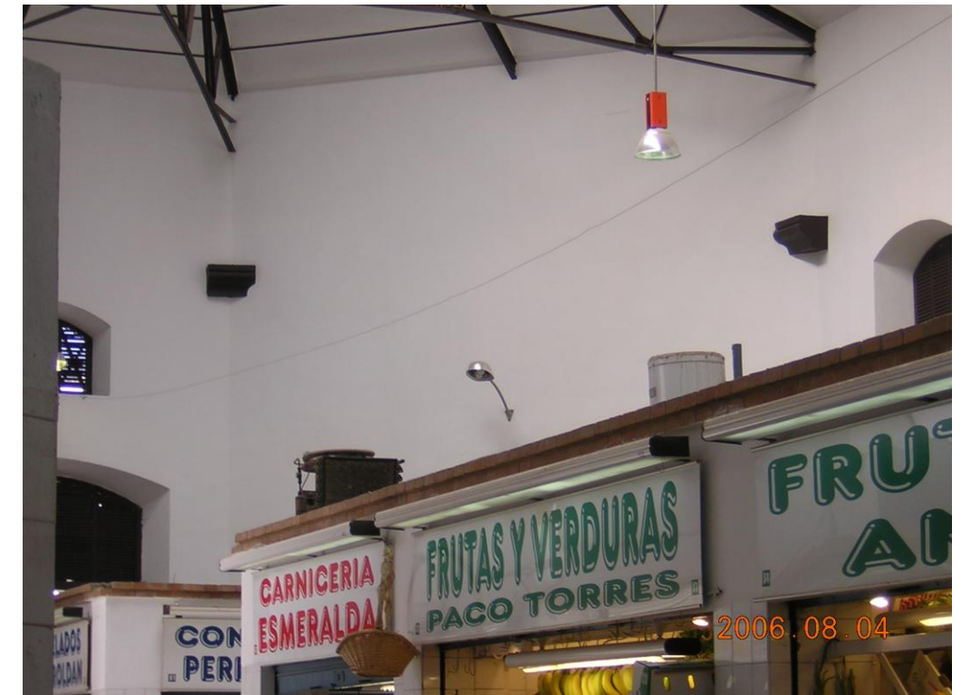
Sistemas de iluminación irregular y heterogénea