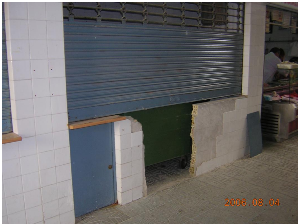
Hueco abierto en un puesto vacío para uso como cuarto de basuras