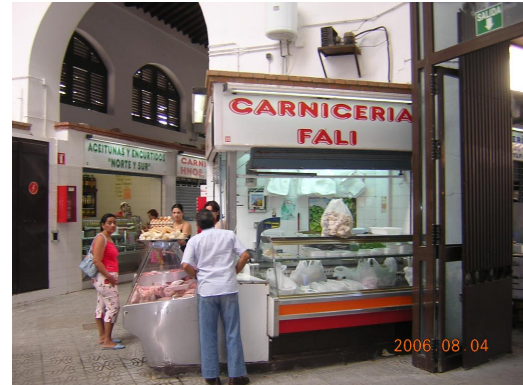
Mueble frigorífico instalado en el pasillo