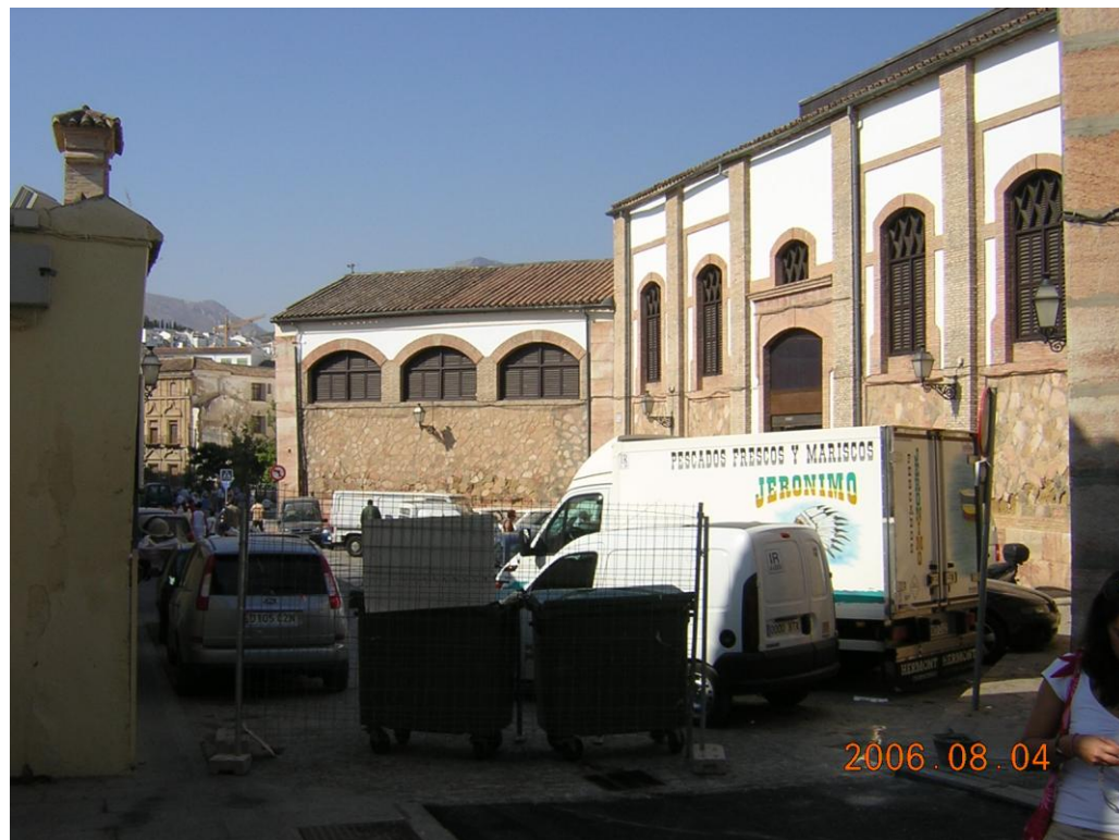
Áreas de descarga de forma irregular.