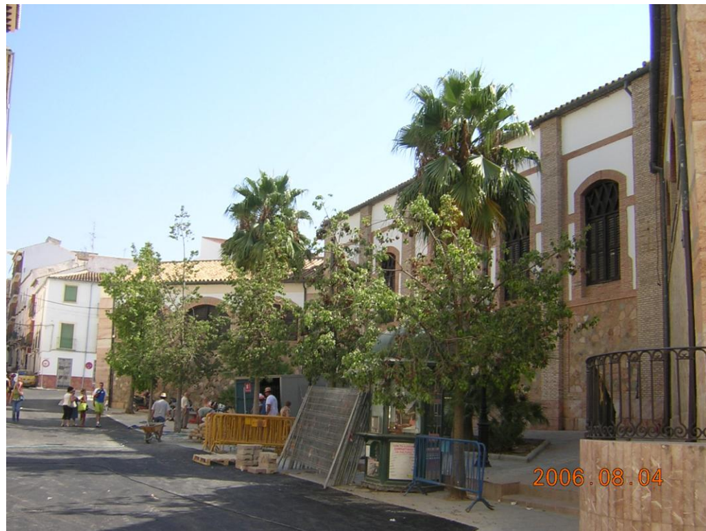
Acceso desde el lateral Oeste. Actualmente en proceso de renovación urbana