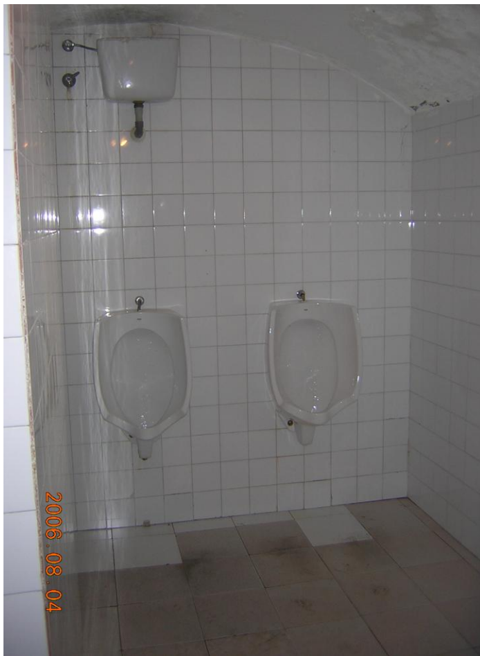
Estado de aseos muy envejecido