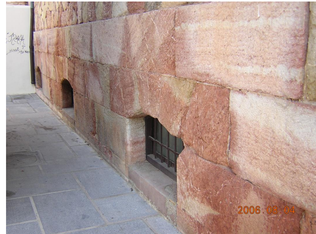
Deterioro de fachada por humedades de capilaridad