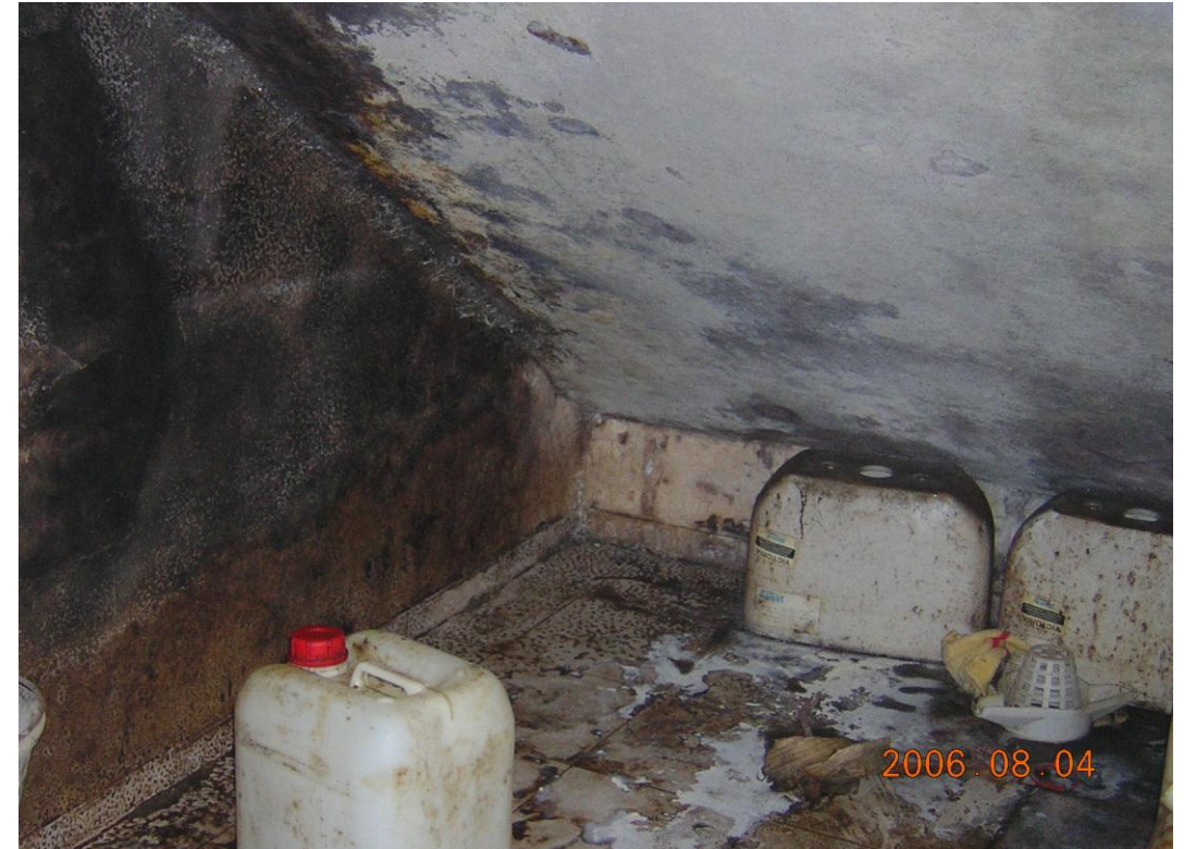
Serios problemas de humedades del terreno. Vestuarios inutilizados.