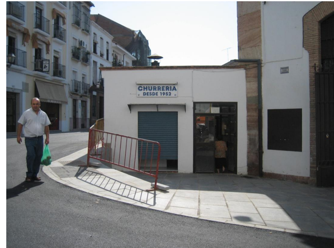
Absorción de desniveles inseguros.