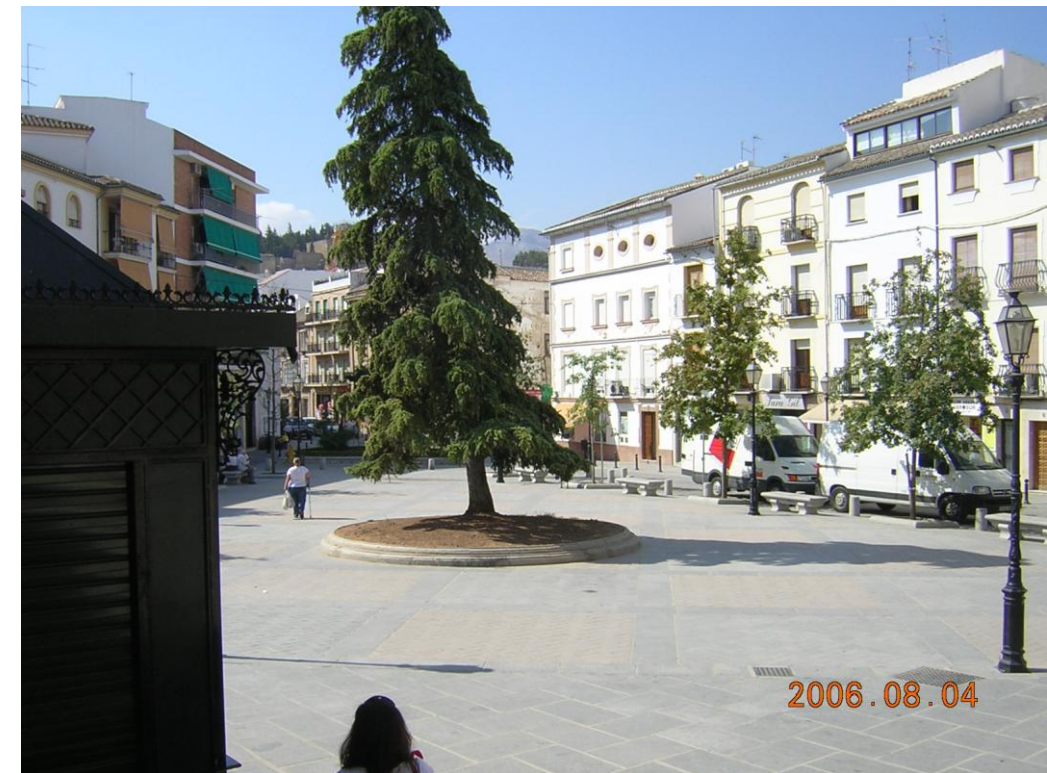
Vista de la Plaza de San Francisco desde el Mercado