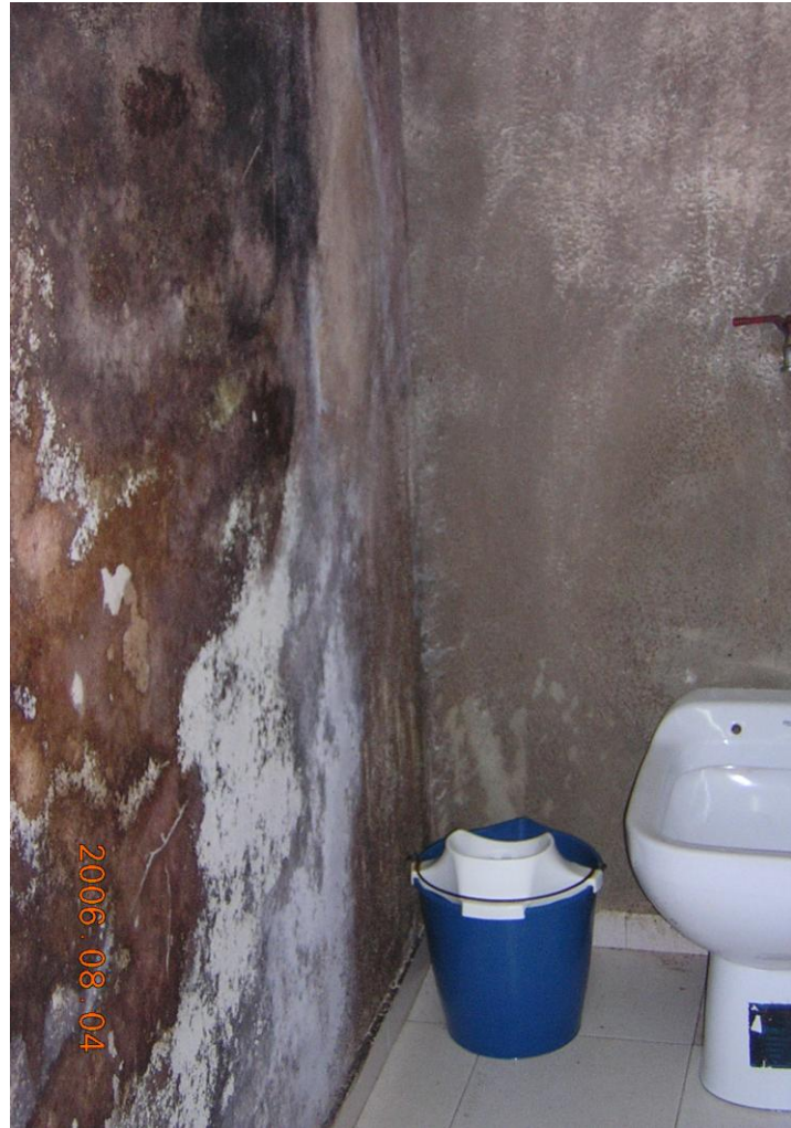
Espacios de servicio impracticables por su precario estado