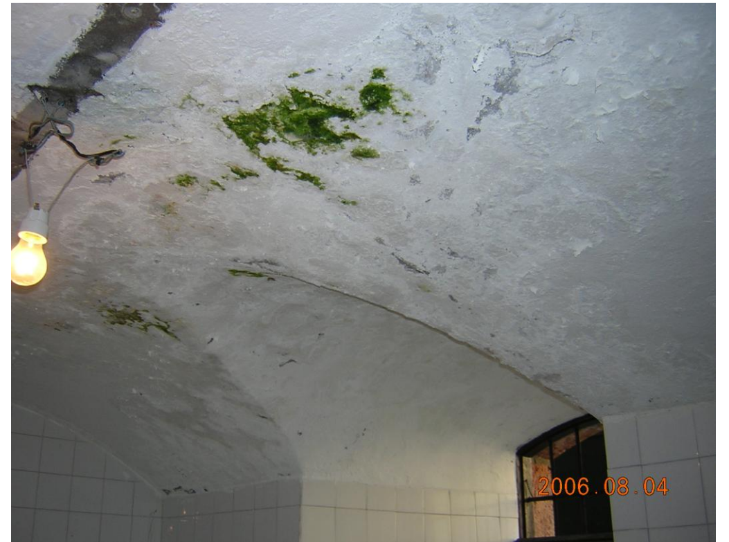
En sótano aparición de hongos por humedades.