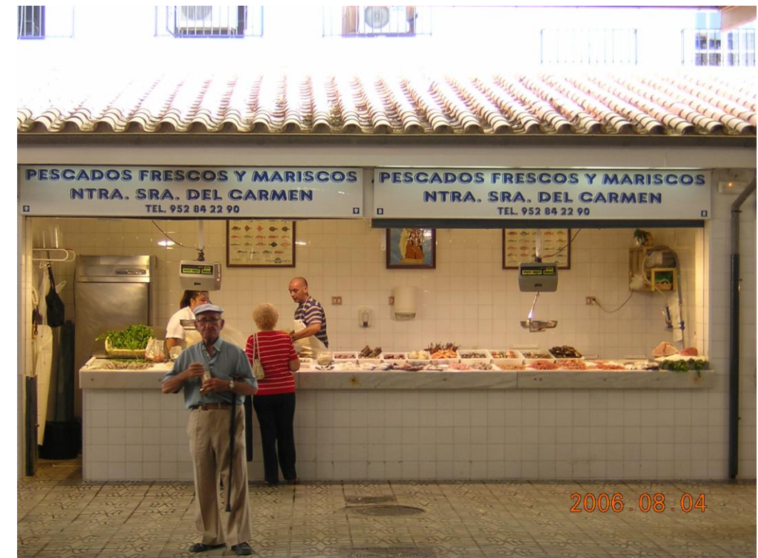
Pescaderías abiertas al exterior sin control térmico