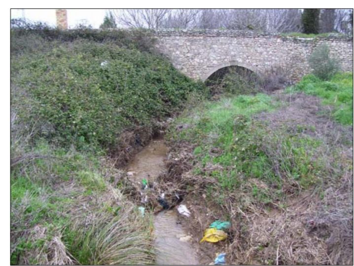
AMPLIACION DE ESTRUCTURA (LINEA FFCC MALAGA-CORDOBA)