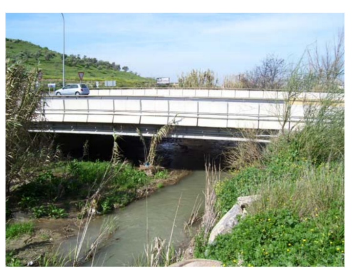
AMPLIACION DE ESTRUCTURA (CARRETERA A-7282)