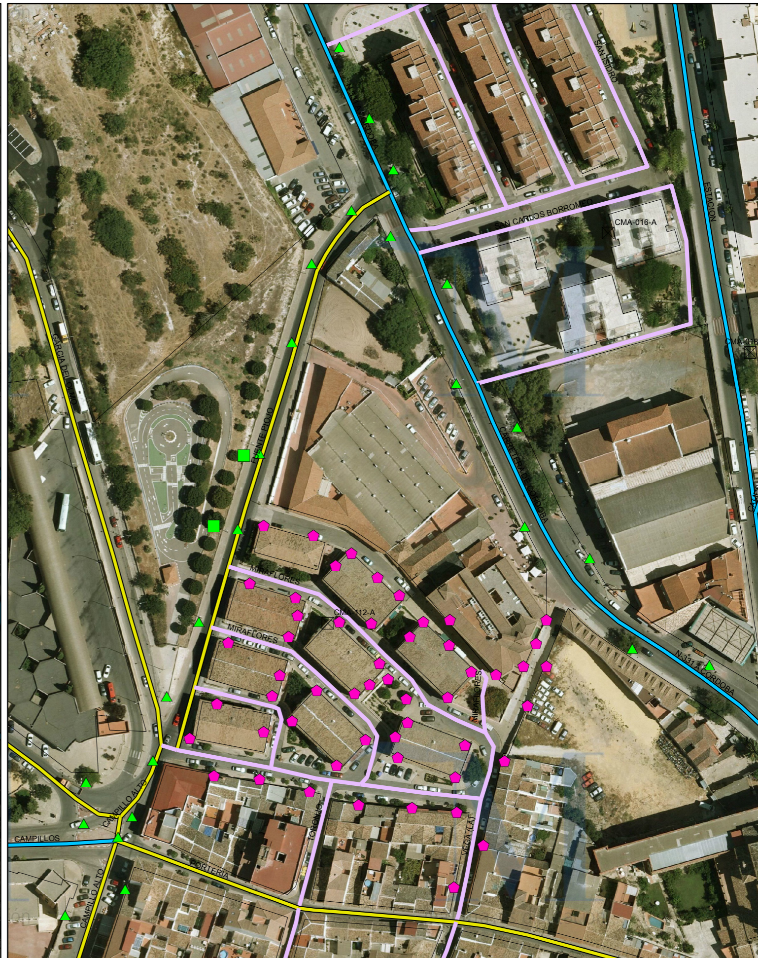
SITUACIÓN FUTURA SEGÚN PDASA