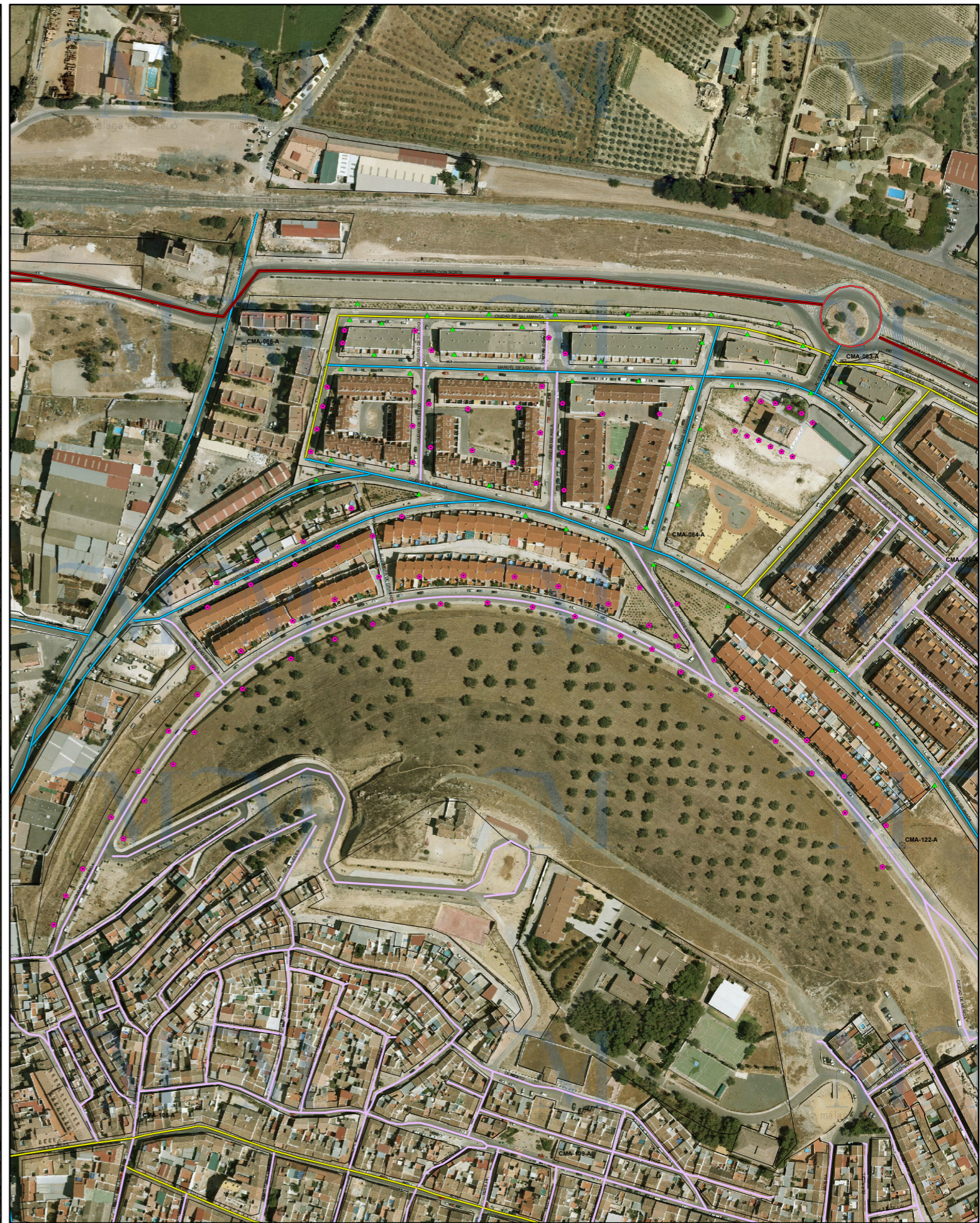
SITUACIÓN FUTURA SEGÚN PDASA