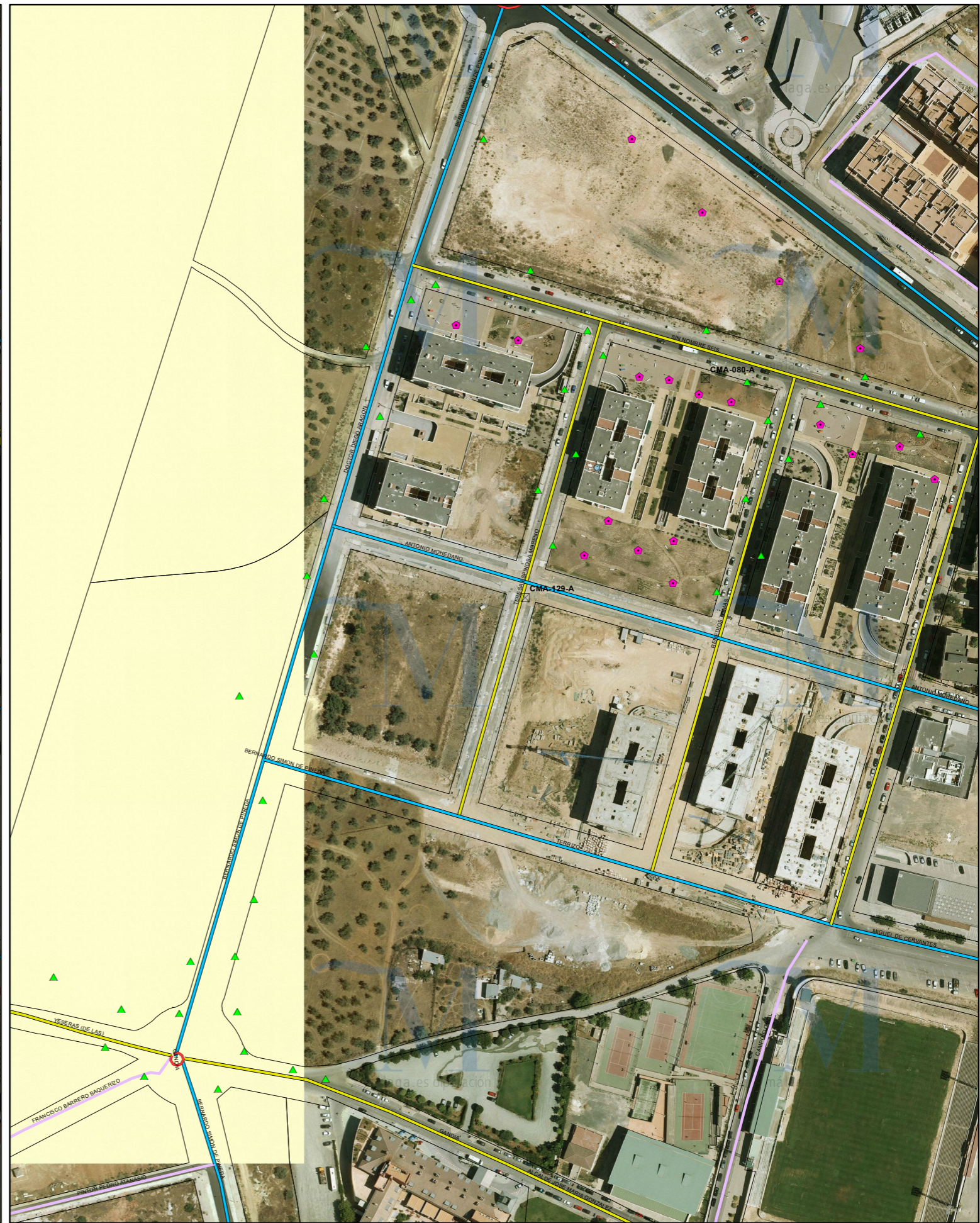
SITUACIÓN FUTURA SEGÚN PDASA