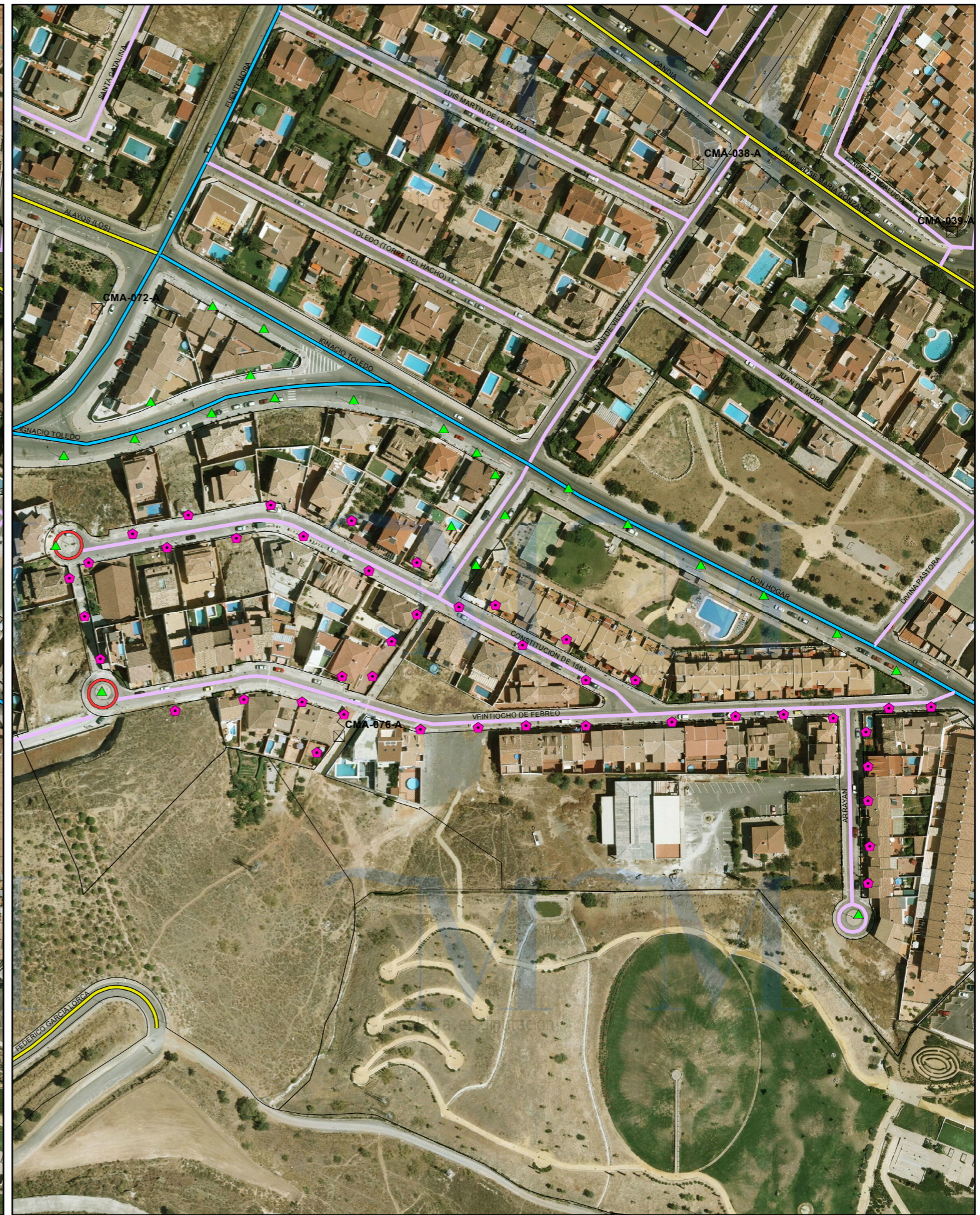
SITUACIÓN FUTURA SEGÚN PDASA