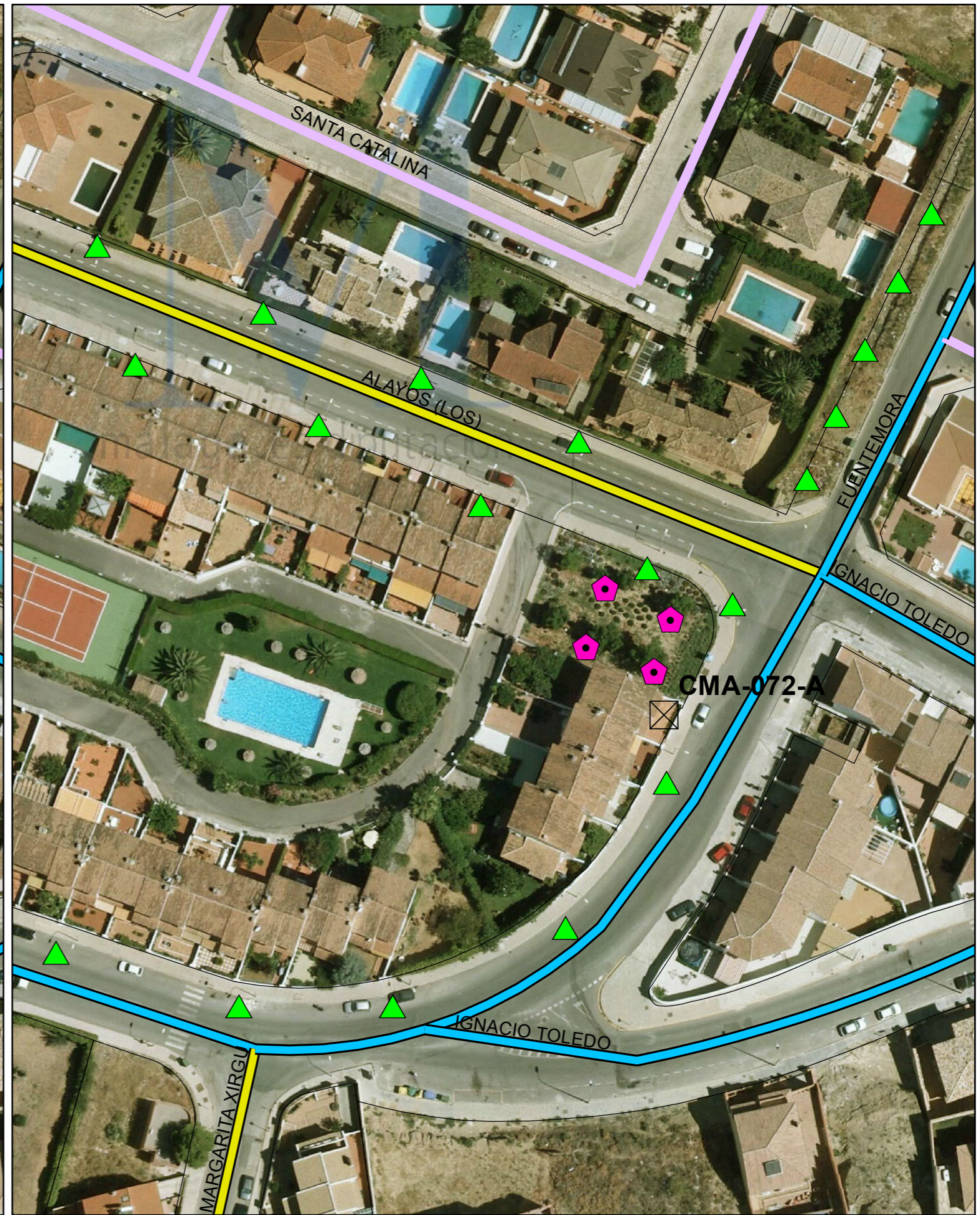
SITUACIÓN FUTURA SEGÚN PDASA