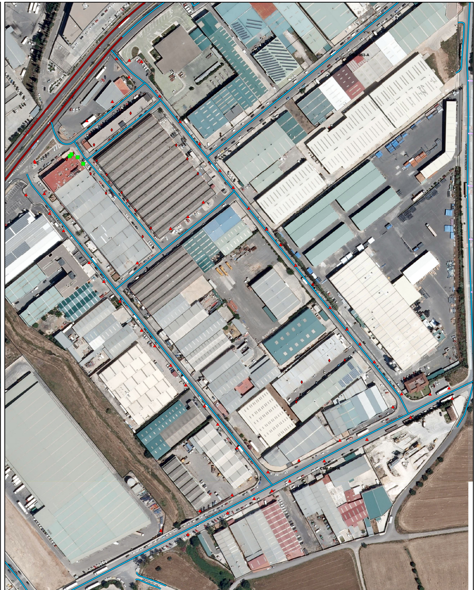
SITUACIÓN FUTURA SEGÚN PDASA