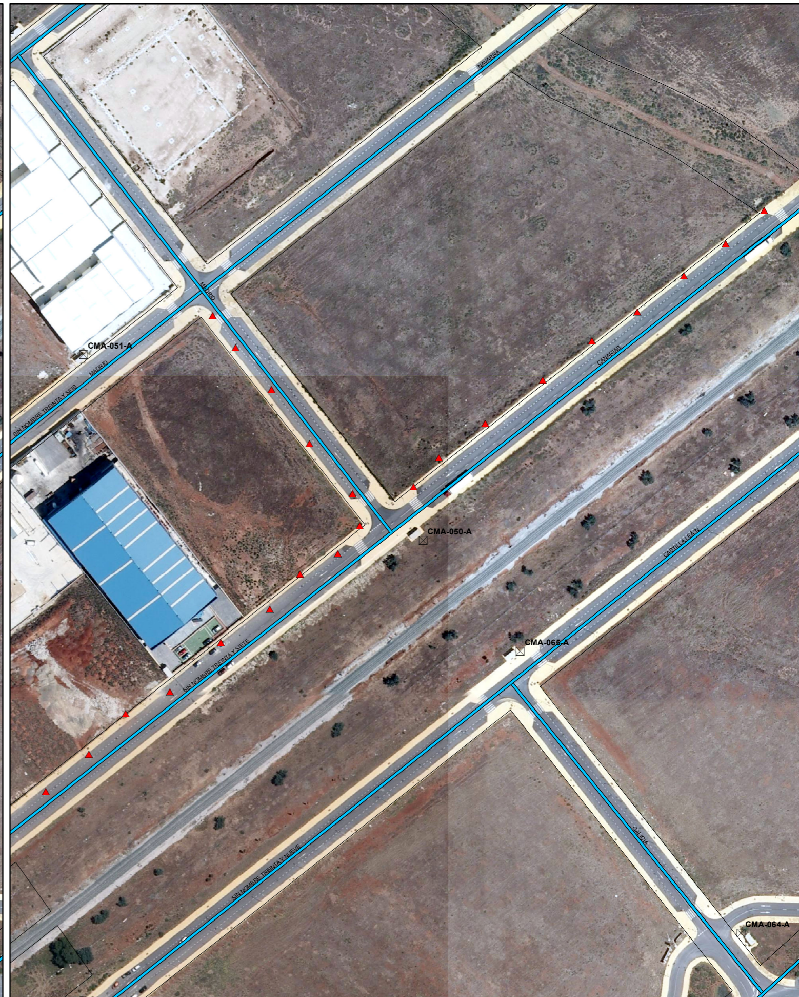
SITUACIÓN FUTURA SEGÚN PDASA