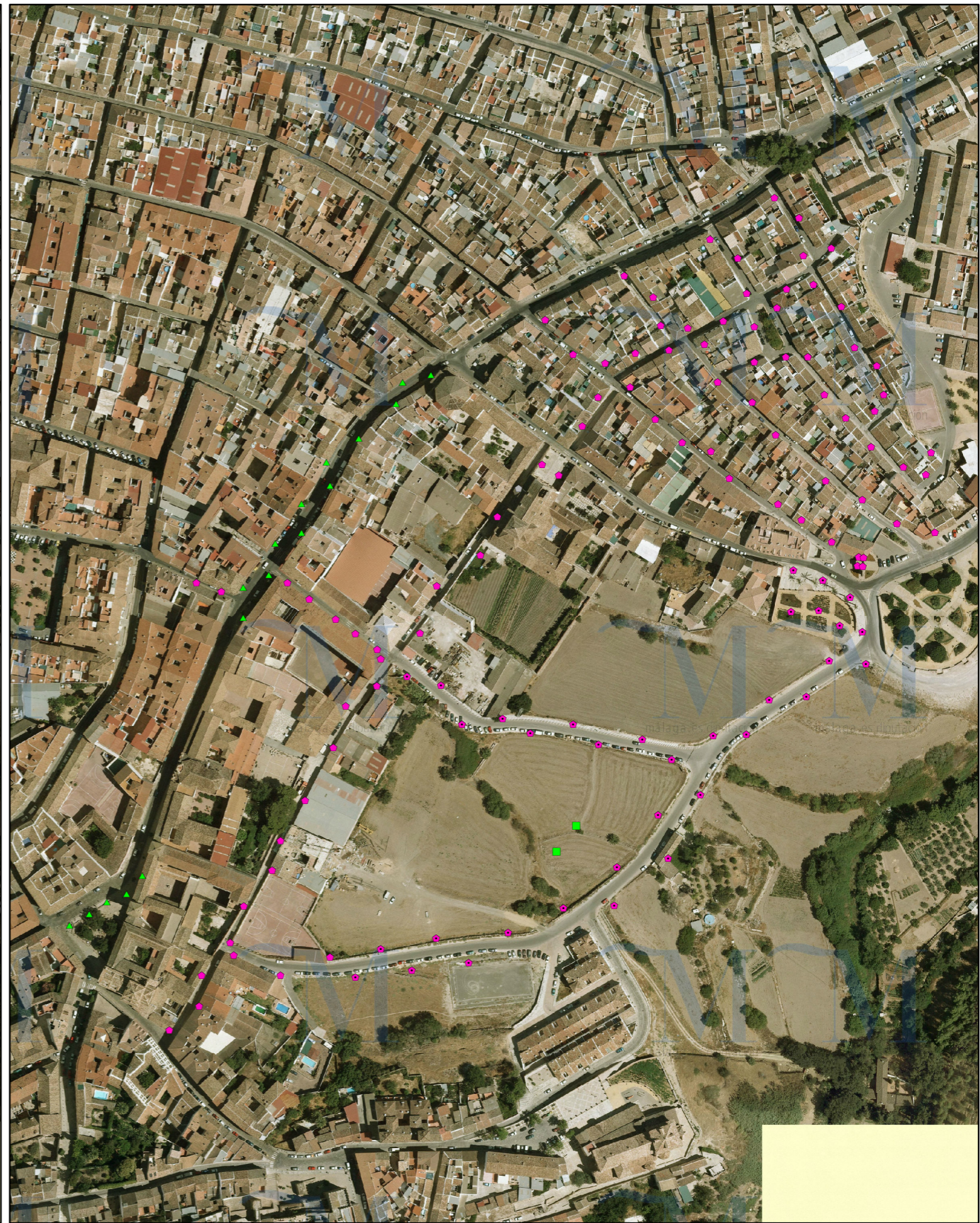
SITUACIÓN FUTURA SEGÚN PDASA